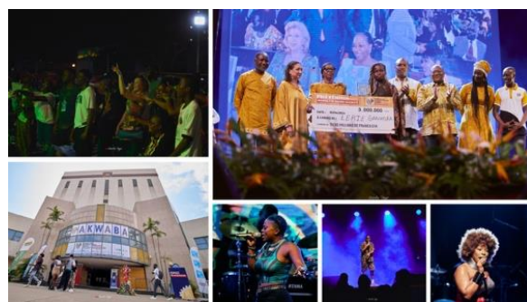
Le MASA 2024 dans toute sa splendeur

Ce sont des chiffres importants en termes de notoriété médiatique qui indique à suffisance l'importance grandissante de ces réseaux de communication interactifs ! Nous tenons à souligner la haute qualité de la communication de la page Facebook (la description des troupes marché/festival), l'agenda quotidien, les actualités, l'ambiance festive ... de la fine dentelle numérique touchant sans doute un public jeune et friand d'interactions !